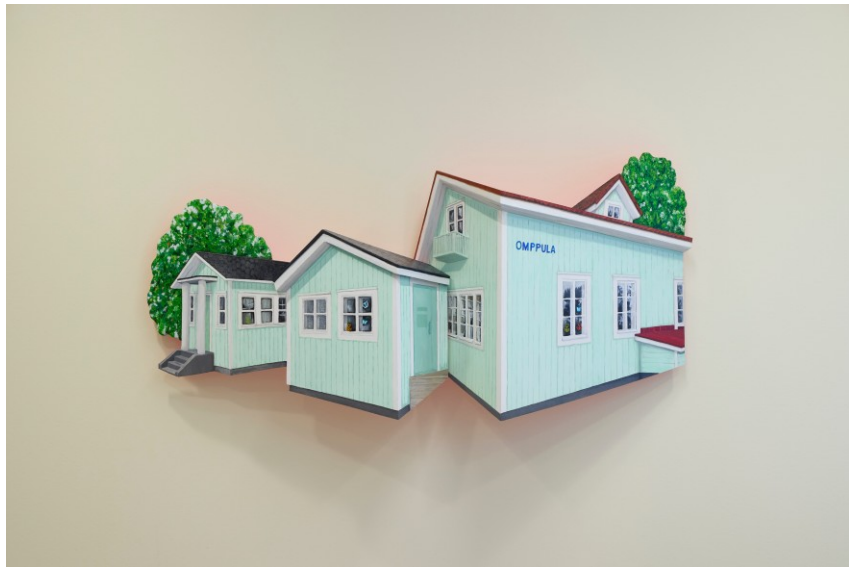
Jenni Yppäriä - Omppula