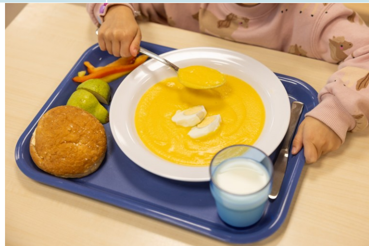
Kuva: Opa Latvala