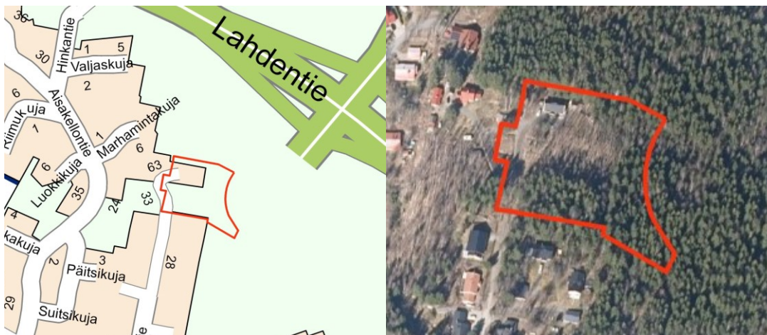
Kuva 1. Suunniteltu asemakaava-alue sijaitsee Kulkustien päässä Kangasalla (rajattu kuvaan punaisella rajauksella)

Yksityisiltä maanomistajilta on tehty aloite omistamiensa alueiden asemakaavoittamiseksi Kangasalan Kulkustien pohjoisosassa. Asemakaavoittamisella tavoitellaan alueelle lisää omakotitontteja, katu- ja viheraluetta sekä kävely- ja pyöräilyreittiä. (kuva 1)