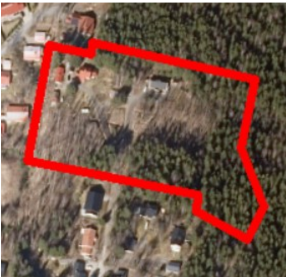
Kuva 3. Asemakaavoitettavalla alueella sekä sen viereisellä kiinteistöllä käytiin tekemässä liito-oravatarkistus 29.4.2021.

Asemakaavoitettavalla alueella sekä sen viereisellä kiinteistöllä käytiin tekemässä liito-oravatarkistus 29.4.2021. (kuva 3) Tarkistus suoritettiin tarkistamalla alueella kasvavien kuusien, koivujen ja haapojen tyviä liito-oravan papanoiden varalta. Samalla kiinnitettiin huomiota mahdollisiin kolopuihin sekä risupesiin. Selvitysalueelta ei kuitenkaan havaittu liito-oravan käyttämiä lisääntymis- tai levähdyspaikkoja tai muitakaan liito-oravan papanoimia puita. Asemakaavoitettavalle alueelle ei siten ainakaan vuoden 2021 liito-oravatarkistuksen mukaan kohdistu suoraan liito-oravan esiintymisestä aiheutuvia rajoitteita.