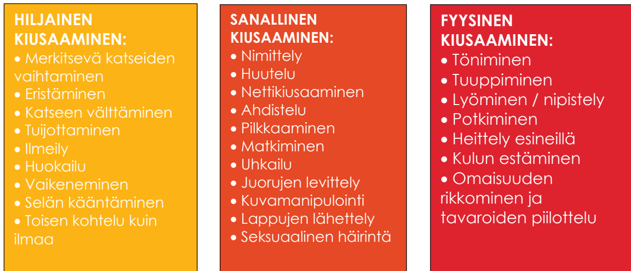
KUVA 1 Eri kiusaamistavoista

Koulussa ei voida hyväksyä asiatonta käytöstä toista ihmistä kohtaan. Voi olla vaikeaa erottaa tasavertaista riitatilannetta, fyysistä kanssakäymistä tai huulenhiettoa varsinaisesta kiusaamisesta. Aina, kun et ymmärrä, mistä ko. tilanteessa on kysymys – kysy ja ota selvää. Älä jätä asiaan puuttumatta. Etenkin hiljaiseen kiusaamiseen on vaikeaa puuttua. Tilanteiden havaitseminen vaatii ulkopuoliselta tarkkaa havainnointikykyä. On kuitenkin hyvä muistaa, että osapuolet voivat kokea nämäkin tilanteet eri tavalla.