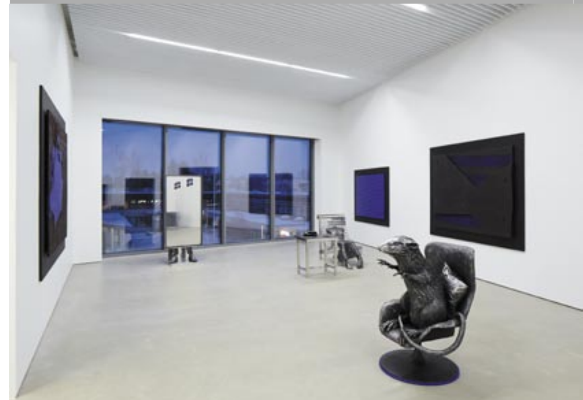
Kimmo Pyykkö -museo.

Kangasala-talon tilaohjelmaan sisällytettiin kulttuuritilojen lisäksi valtuuston ja kunnanhallituksen kokoustilat sekä Kimmo Pyykkö -museon näyttelytilat. Kuvanveistäjä Pyyköllä oli merkittävä osuus suunnittelun tavoitteiden ja ratkaisujen määrittelyssä. Yhteydet ja yhteistoimintamahdollisuudet kirjaston kanssa ovat myös olleet suunnittelun avaintekijöitä.