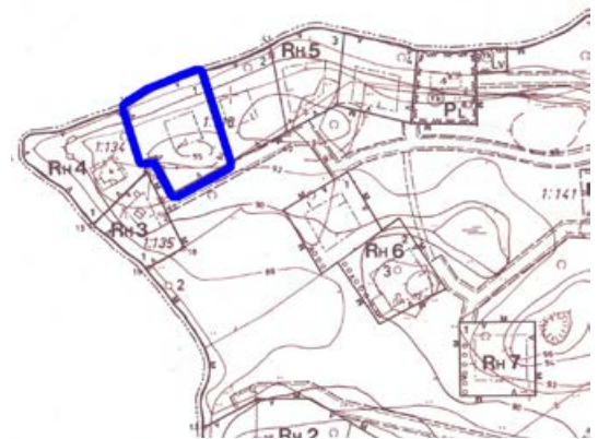
Ote Köyrän ja Palon rantakaavasta.